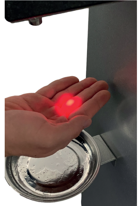
Sensor-Lichtpunkt führt die Hand an die richtige Stelle

Aktionspreis: 918,00 € zzgl. MWST und Versand