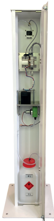
LED-Füllstandsanzeiger + Akku-Ladezustandsanzeiger