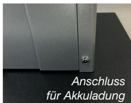
Anschluss für Akkuladung