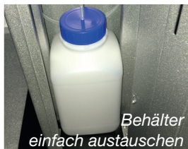
Behälter einfach austauschen